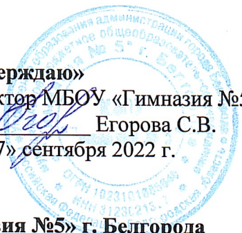
График оценочных процедур в 1-4 классах МБОУ «Гимназия №5» г. Белгорода на первое полугодие 2022-2023 учебного года